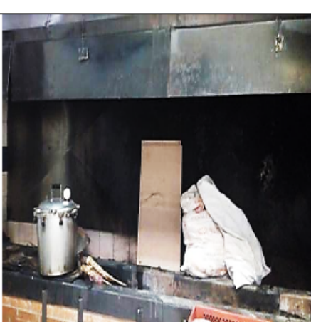
FOTOGRAFÍA 4. INTERIOR DE LA HORNILLA