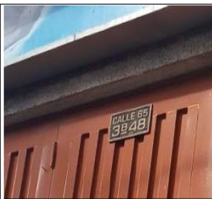
FOTOGRAFÍA 2. PLACA DEL PREDIO