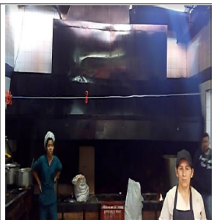
FOTOGRAFÍA 3. ASPECTO GENERAL DE LA HORNILLA